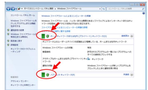
図 2 : Windows ファイアウォール確認画面